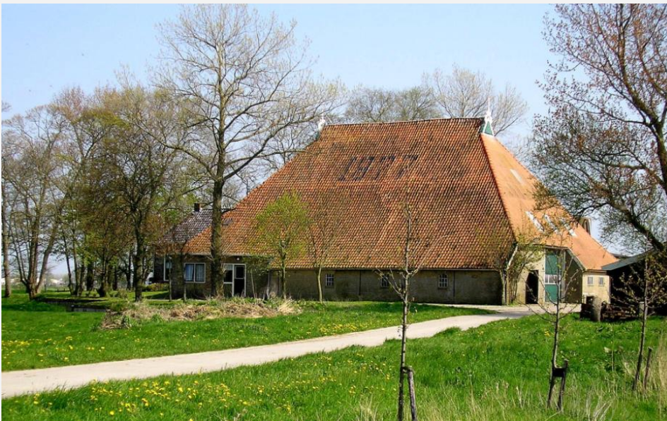
Walma State schuur 1877

Walma state is een kop romp boerderij. De boerderij heeft geen hals. Het voorhuis loopt door tot de schuur. Daardoor heeft de boerderij een grotere zolder. Walma state was een gemengd bedrijf. Bij de boerderij hoort in 1511 een stukje “saedland” van 6 pondenmaat. Het voorhuis is in 1906 herbouwd door Klaas Rollema en Baukje van der Goot.