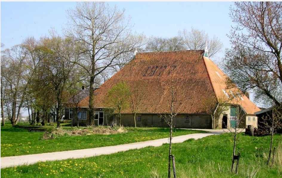
Walma State skuorre 1877