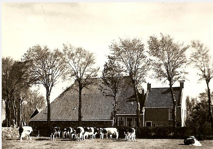
De pastorij pleats

Wenje yn de kop, wurkje yn de hals, opslach yn de skuorre. De skuorre fan it langhûs wurdt grutter makke. Dizze wurdt bytiden sels oer de âlde stâl hinne boud. It foarhûs stiet net rjocht foar de skuorre, mar oan de kant dêr't de kij, krekt as by it langhûs, yn it bûthús stean. It fee stiet mei de kop tsjin de bûtenmuorre oan foar in bûthúsrútsje. Dizze ruten binne tige wichtich, want oan it tal rútsjes is te sjen hoe ryk oft de boer is. De heaberch ferdwynt, it hea wurdt no yn'e midden fan'e skuorre, de golle, opslein. Njonken de golle, yn'e skuorreed, is opslach foar it materiaal.