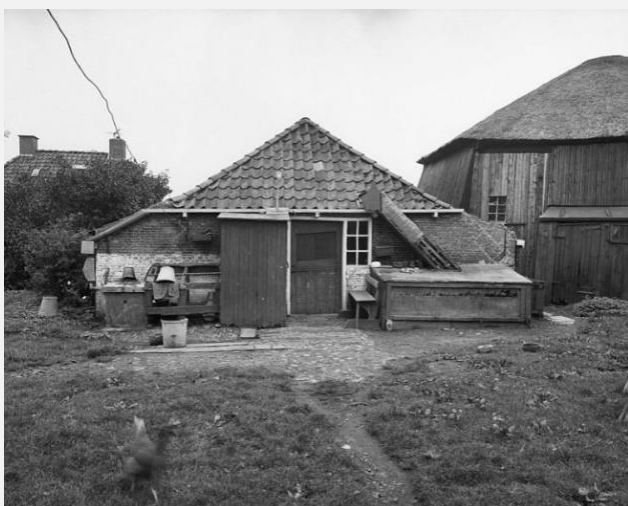
de stâl fan de pleats