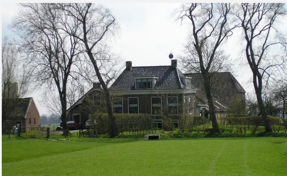
Carpe Diem pleats 1907

Begjin 1900 feroaret it ynsjoch yn it boerebedriuw. De kij ha mear ljocht en romte nedich en automatisearing docht syn yntree. It grutte foarhûs mei dêr ûnder de molkkelder, is net wat dizze pleats sa besûnder makket. Achter it foarhûs, yn de skuorre, is de nije tiid oanbrutsen. De Hollânske stâl docht syn yntree. De kij steane foar it earst net mear mei de kop tsjin de bûtenmuorre. Yn de Hollânske stâl stiet it fee mei de kop nei elkoar ta, skieden troch in weidegong. Mei in railsysteem fanút de skuorre, wurdt it hea nei de kij ta brocht. De grophe leit, mei in rinpaad, tsjin de sydmuorre oan. De fentilaasje yn de stâl wurdt ferbettere. De stâlruuten wurde grutter en de feint kriget in aparte keamer nêst de stâl.